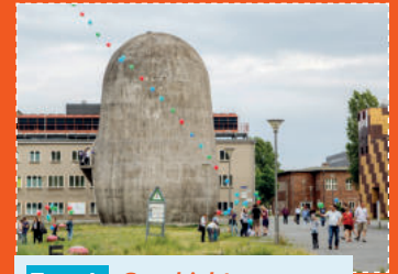
Tour 4 Geschichte Technologiepark Adlershof