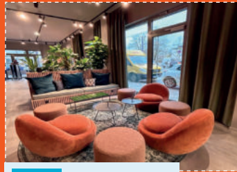
Tour 2 Adlershof – mein Kiez