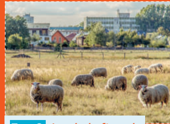
Tour 3 Landschaftspark Johannisthal/Adlershof